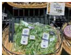
新潟県内のスーパー