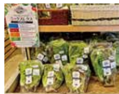
新潟県内の道の駅