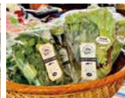
各種イベントでの販売