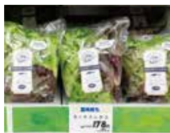
イオン 新潟県内の店舗