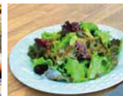
新潟県内の飲食店へ卸売