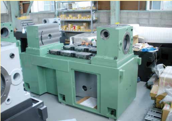
各種工作機械組立